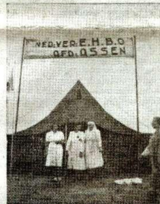
Eén der hulpverleningstenten voor het publiek.

Er is natuurlijk alle kans, dat ik e.e.a. over het hoofd heb gezien, maar dan komt dat toch omdat niet voldoende de aandacht op onze E.H.